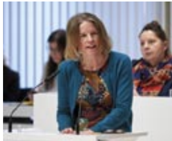
Constanze Oehlich, BÜNDNIS 90/DIE GRÜNEN