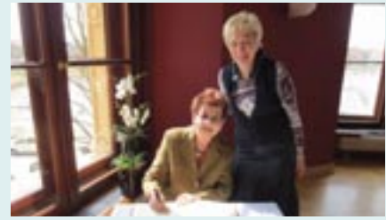
Batsheva Dagan mit der damaligen Landtagspräsidentin Sylvia Bretschneider 2013 beim Eintrag in das Ehrenbuch des Landtages Mecklenburg-Vorpommern.

Texten, darunter auch Kinderbücher. Das Kinderbuch „Chika, die Hündin im Ghetto“ konnte mit Unterstützung aus Mecklenburg-Vorpommern verfilmt werden. 2019 war Batsheva Dagan letztmals zu Gast im Landtag Mecklenburg-Vorpommern und berichtete als Zeugin im Rahmen der Gedenkstunde des Parlamentes anlässlich des Tages des Gedenkens für die Opfer des Nationalsozialismus von dieser Zeit und auch ihrem späteren Wirken als Zeugin.