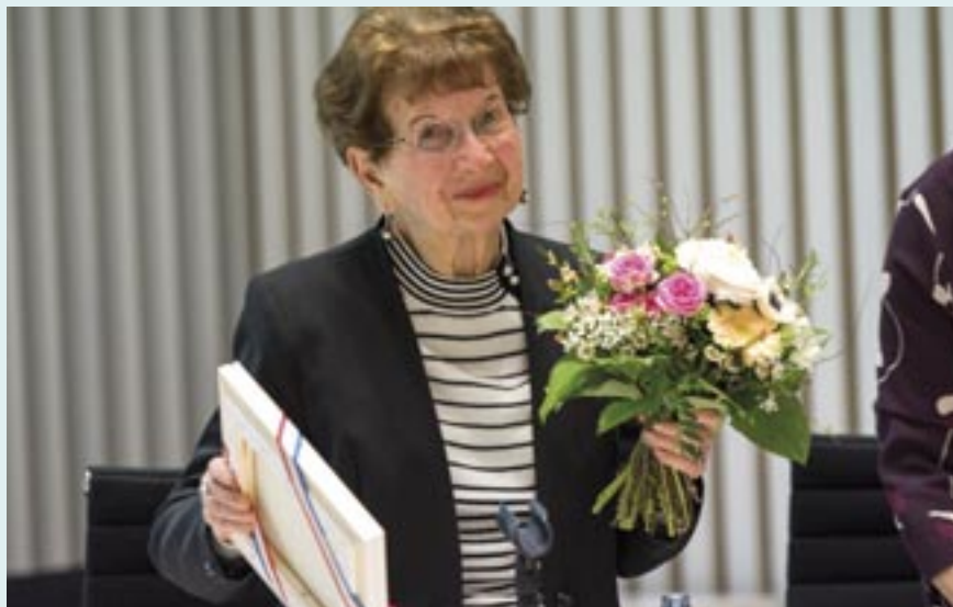
Batsheva Dagan am 22. Januar 2019

Ihre Stimme ist nun für immer verstummt. Ihre Botschaft aber lebt in allen Menschen, die das Glück hatten, sie kennenzulernen.