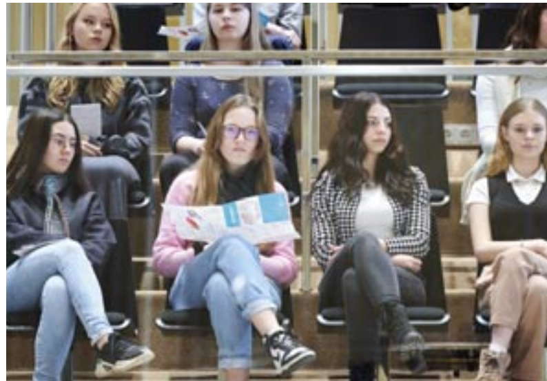
Schülerinnen des Gymnasiums Neustrelitz

Und deshalb [...] sind wir alle gefragt, die AfD politisch zu bekämpfen, [...] sie als eine unsoziale Partei zu entlarven. [...]