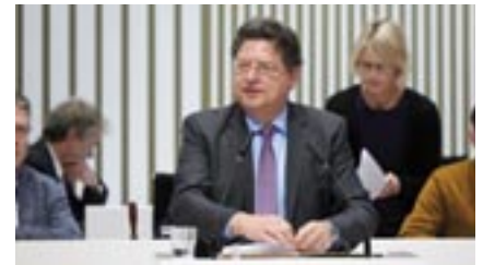
Minister Reinhard Meyer

Und das Zweite, die konkrete Nachfrage: Was hat die Landesregierung getan, um rechtlich zu prüfen, ob das überhaupt notwendig ist, dort positive landesplanerische Stellungnahmen zu erteilen?