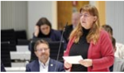
Jutta Wegner (BÜNDNIS 90/DIE GRÜNEN)

geht es vor allen Dingen um das Thema Umweltverträglichkeitsprüfung im grenzüberschreitenden Rahmen. Das kennen wir alles.