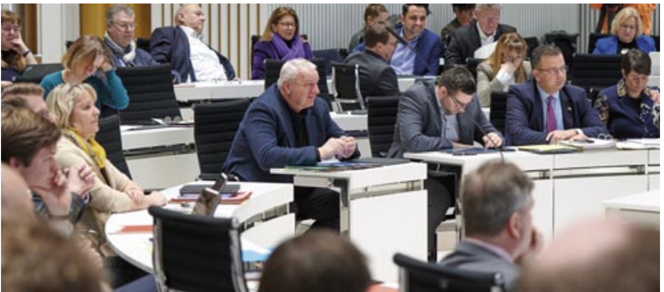
v.l.n.r.: Abgeordnete der Fraktionen SPD, BÜNDNIS 90/DIE GRÜNEN, CDU und FDP.

[...] Meine Damen und Herren, das gilt im Übrigen auch für alle die, die politisch und gesellschaftlich [...] Verantwortung tragen. Wir dürfen [...] Diskussionen führen, das gehört im demokratischen Dialog dazu. Die Frage ist [...] Geht es eigentlich noch um das Argumentieren für meine Position oder geht