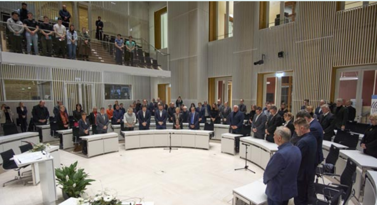
Mit einer Schweigeminute gedachten die Anwesenden der Opfer.