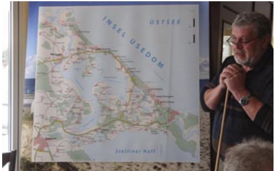
Der Petent erläutert anhand einer Karte, welche Missstände am und im Gothensee behoben werden müssen.

An der Sitzung nahmen neben dem Petenten auch Vertreter des Landwirtschaftsministeriums, des Staatlichen Amtes für Landwirtschaft und Umwelt Vorpommern sowie des Landkreises Vorpommern-Greifswald teil. Zunächst tauschten sich die Beteiligten über die derzeitige Situation aus. Hierbei wurde deutlich, dass die von den zuständigen